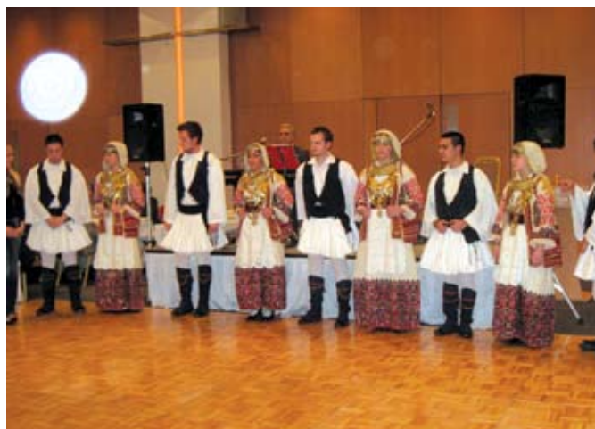
Χορευτική ομάδα Δήμου Αχαρνών με παραδοσιακές φορεσιές της περιοχής.

Είμαι βέβαιος ότι όλοι εσείς απόψε παραμερίσατε τις δικές σας προτεραιότητες και οικογενειακές ανάγκες και ήλθατε εδώ για να ενισχύσετε ηθικά και υλικά την Αγιοταφική αδελφότητα, η οποία έχει για λογαριασμό όλων μας, την ευθύνη της διαφύλαξης των Ιερών μνημείων και κειμηλίων ένα έργο πολύμοχθο, τιτάνιο, και δυσβάστακτο για τους ώμους ολίγων εναπομεινάντων Αγιοταφικών.