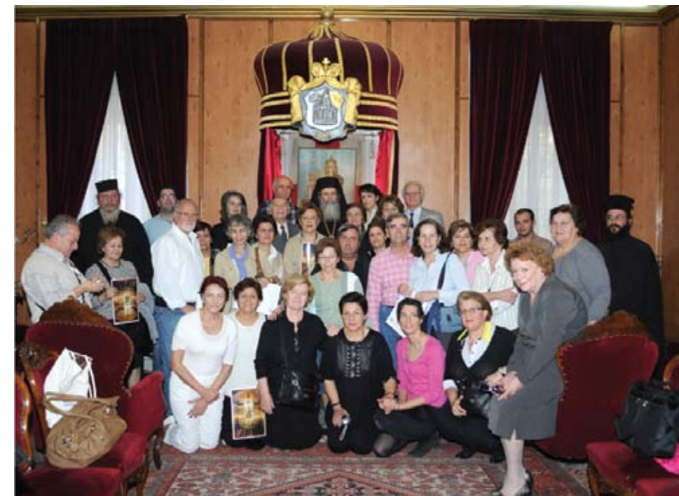
Ο Πατριάρχης Ιεροσολύμων κ.κ. Θεόφιλος μαζί με τους εκδρομείς του Συνδέσμου στην αίθουσα του Πατριαρχικού θρόνου.

Ο Μακαριώτατος επέδωκεν εις το Διοικητικόν Συμβούλιον του Συλλόγου το βιβλίον του κ. Δημητρακοπούλου περί του τόπου του Βαπτίσματος του Κυρίου .