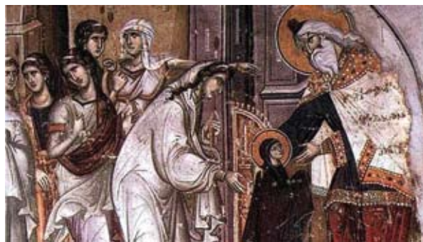
Χριστιανική οικογένεια συνοδεύει το τέκνο της στη Θεία Μεταληψη.

ενδιαφέρεται ιδιαίτερα για τους αδικοκούμενους, τους φτωχούς και τους θλιβόμενους. Να καλλιεργεί τον ειληκρινή σεβασμό στην αξιοπρέπεια του κάθε ανθρώπου ως "εικόνα Θεού"