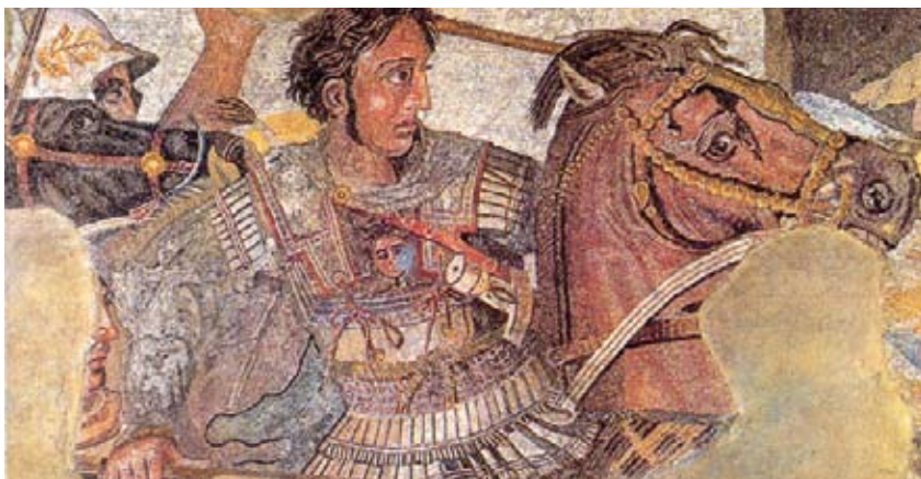
Ο Μέγας Αλέξανδρος νικά το Δαρείο στη μάχη της Ισσού.

Ένας από τους στρατηγούς έκπληκτος από τις ασυνήθιστες επιθυμίες, ρώτησε τον Αλέξανδρο ποιοι ήταν οι λόγοι.