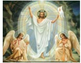
Η Ανάσταση του Κυρίου.

σε όλα τα μέλη και τους φίλους του Συνδέσμου μας χαρούμενο και ευλογημένο Πάσχα. Η ευλογία του Παναγίου Τάφου πάντοτε να τους συνοδεύει.