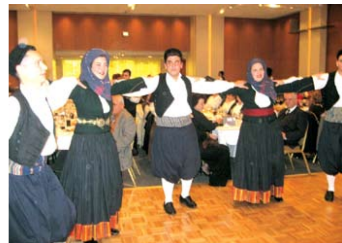
Χορευτικό του Λυκείου ελληνίσων Παπάγου.