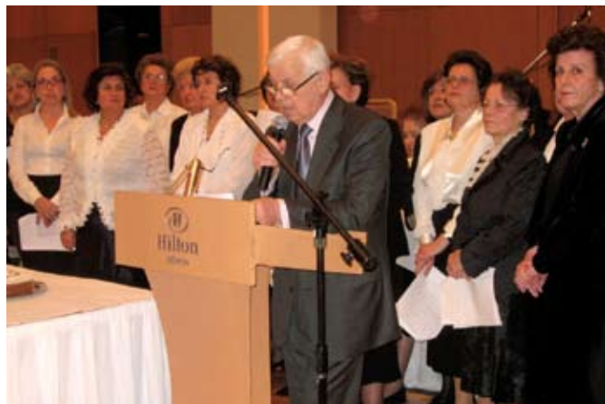
Ο πρόεδρος εκφωνεί την ομιλία του. Πίσω του η χορωδία Ιερού Ναού Αγίας Παρασκευής.

Κυρίες και Κύριοι, η παρουσία σας εδώ απόψε, παρά τις οικονομικές δυσκολίες που αντιμετωπίζει η Πατρίδα μας και ο καθένας από εμάς ξεχωριστά, αποδεικνύει την αγάπη σας και το μεγάλο ενδιαφέρον για τους Αγίους Τόπους και την Αγιοταφική αδελφότητα.