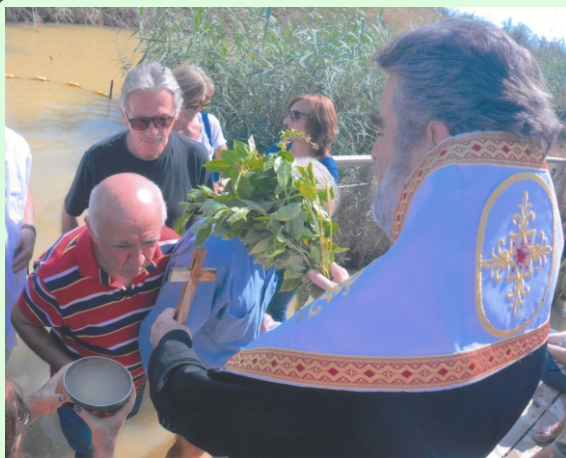
Φωτογραφίες από τον Αγιασμό (Συμβολικό Βάπτισμα) στον Ιορδάνη ποταμό από τον Αρχιεπίσκοπο Γεράσιον Θεοφάνη.

Προϊστάμενος του Ιερού Ενοριακού Ναού Αγίου Αντωνίου Ἄνω Πατησίων