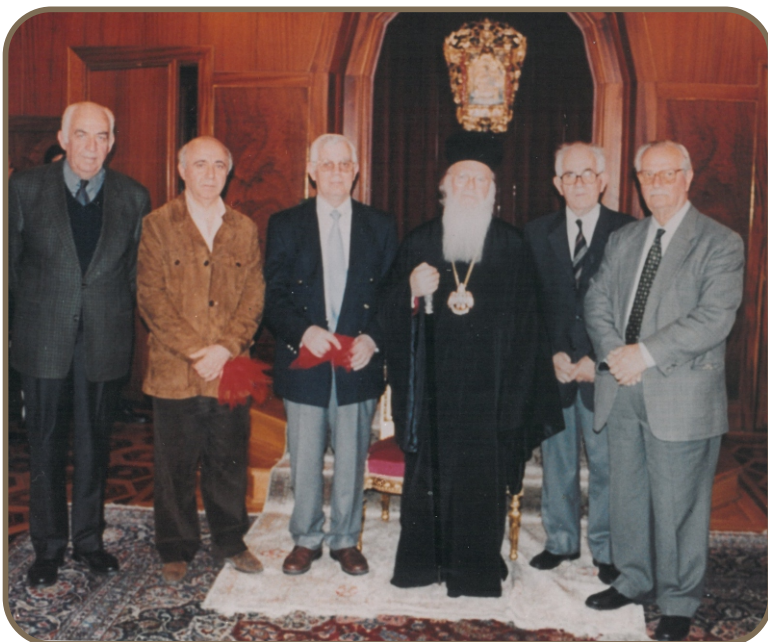
Από την επίσκεψη των μελών του Δ. Σ. στο Οικουμενικό Πατριαρχείο