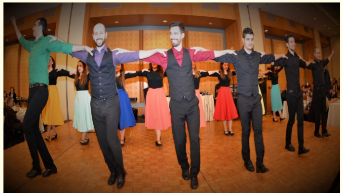
Χορευτικό στιγμιότυπο του Κέντρου Λαϊκού Πολιτισμού Αιγάλεω.