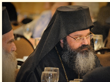
Ο π. Διονύσιος (Σιναΐτης)