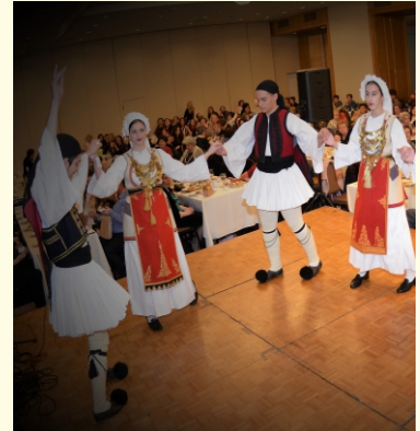
Χορευτικό στιγμιότυπο του Λυκείου Ελληνίδων Παπάγου-Χολαργού

Την Βασιλόπιτα ευλόγησε ο Τιτουλάριος Μητροπολίτης Βελεστίνου Δαμασκηνός συμπαραισταμένων των Πανοσιολογιωτάτων Αρχιμανδριτών: