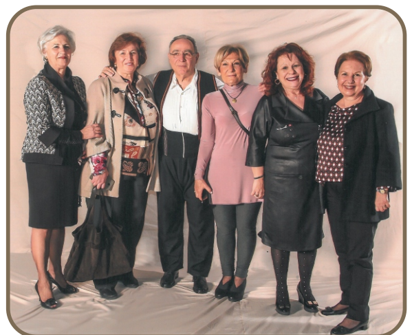
Από την συμμετοχή μελών του Ελληνικού Συνδέσμου στην εκδήλωση παραδοσιακών χορών του Συλλόγου Νοσοκομείου Σωτηρία υπό την αιγίδα του Χοροδιδασκάλου Δημ. Ζέρβα.