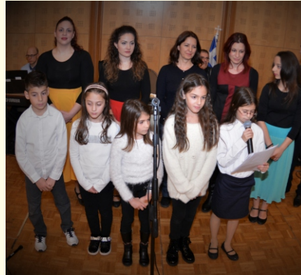
Χορωδία παιδιών του Κέντρου Λαϊκού Πολιτισμού Αιγάλεω