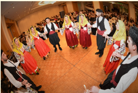
Χορευτικό στιγμιότυπο του Λυκείου Ελληνίδων Παπάγου-Χολαργού