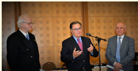
Ο Πρώην Υπουργός Εθν. Αμυνας κος. Πάνος Παναγιωτόπουλος με τον Πρόεδρο & τον Αντιπρόεδρο του Συνδέσμου.

Ο Πρόεδρος κος Λάζαρος Μάρκου καλωσόρισε, ευχαρίστησε τους παρευρισκόμενους και προέβη σε σύντομο απολογισμό των δρώμενων του Συνδέσμου.