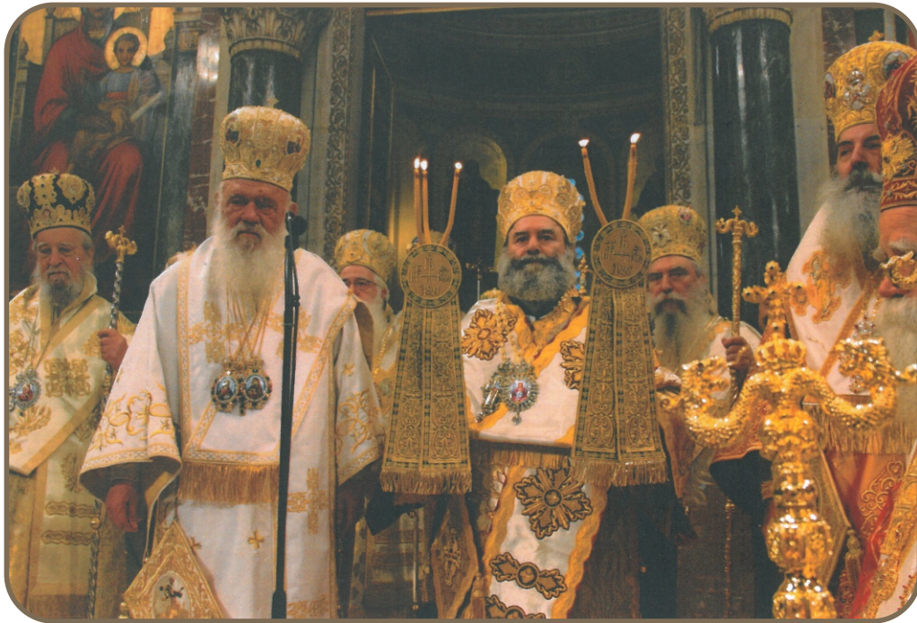
Φωτογραφία από την Χειροτονία του Σεβασμιωτάτου Μητροπολίτου Μάνης κ. Χρυσόστομου Γ'. Το Δ.Σ. του Συνδέσμου εύχεται όπως η ευλογία του Παναγίου και Ζωοδόχου Τάφου τον συνοδεύει στα νέα ποιμαντικά του καθήκοντα.