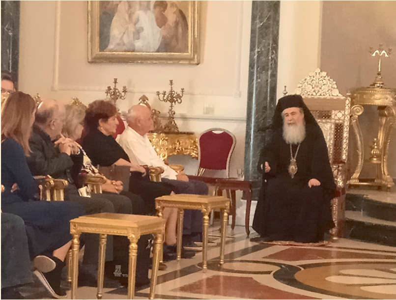
Από την επίσκεψη στον Πατριαρχικό Θρόνο με την Α. Θ. Μ. Πατριάρχη Ιεροσολύμων Θεόφιλο Γ'.

Στις 29/10 - 4/11/2018 πραγματοποιήθηκε με μεγάλη επιτυχία η προσκυνηματική εκδρομή στους Αγίους Τόπους. Επισκεφθήκαμε σχεδόν όλα τα προσκυνήματα εντός και εκτός των τειχών. Εκκλησιαστήκαμε στον Ι. Ναό της Γεννήσεως Βηθλεέμ και στον Ι. Ν. Ιωάννη Προδρόμου Ιορδάνη όπου έγινε ειδική λειτουργία για τα μέλη του Συνδέσμου. Συμμετείχαμε στην αγρυπνία που έγινε στον Πανάγιο Τάφο χοροστατώντος του Σεβασμιωτάτου Μητροπολίτου Καπητωλιάδος Ησυχίου και άλλων Ιεραρχών. (Και στους 3 εκκλησιασμούς σχεδόν όλα τα μέλη της εκδρομής έλαβαν Θεία Κοινωνία.)