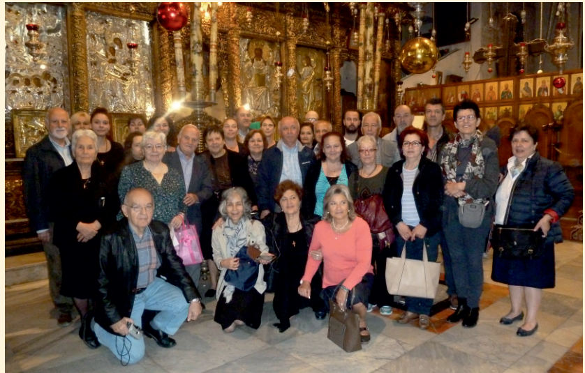
Από την επίσκεψη των μελών του Συν/μου στην Ι. Μ. Αγίου Συμεών (Καταμόνας).