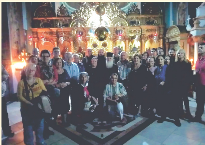
Στην Ι. Μ. Μάρθας & Μαρίας, Βηθανία με τον Αρχ/πο Θαβωρίου Μεθόδιο.