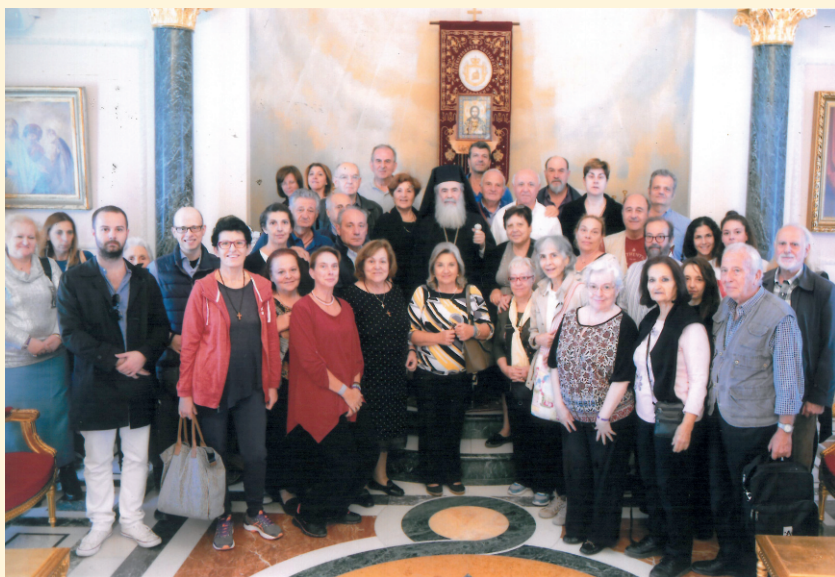
Από την συνάντηση των Προσκυνητών στην Αίθουσα του Θρόνου με την Α. Θ. Μ. Πατριάρχη Ιεροσολύμων Θεόφιλο Γ'.