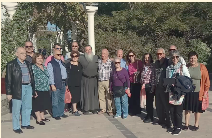
Από την επίσκεψη στην Καπερναούμ με τον Ηγούμενο της Ι. Μ. π. Ειρήναρχο